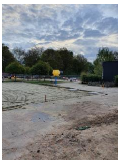
De grond wordt gelijk gemaakt voor de noodunits.