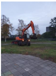
De graafwerkzaamheden zijn gestart!